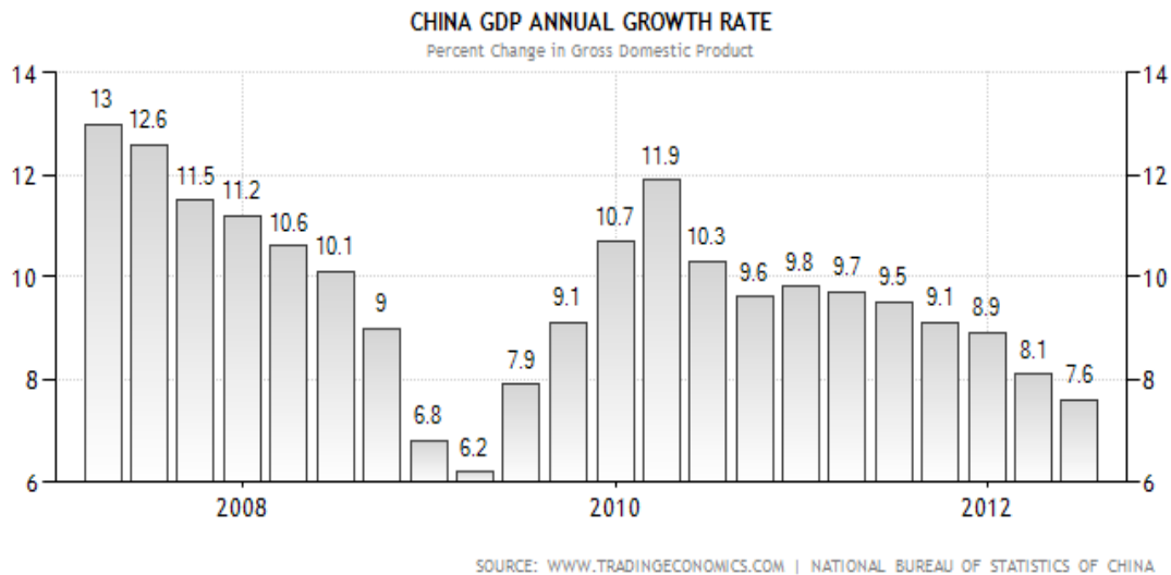
Grafic nr.1. Rata de creștere anuală a PIB-ului Chinei ( http://www.tradingeconomics.com/china/gdp-growth-annual )

O altă performanță specială privește contribuția Chinei la creșterea globală. Ritmul impresionant de creștere națională și constanta realizării acestuia a amplificat puterea economică a acestei țări în ierarhia mondială.